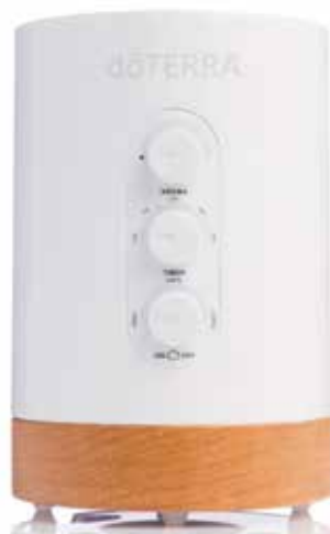
dōTERRA Cloud difúzer

33330000 | 2 nádstavce do držiaka na olej