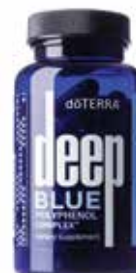
Deep Blue polyfenolový komplex