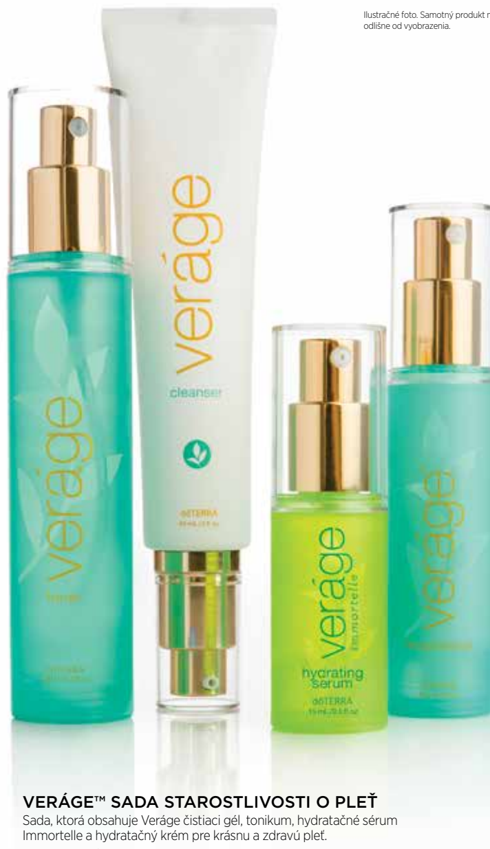
Ilustračné foto. Samotný produkt môže vyzerat odlišne od vyobrazenia.