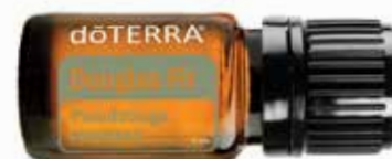
DUGLASKA TISOLISTÁ ESENCIÁLNY OLEJ